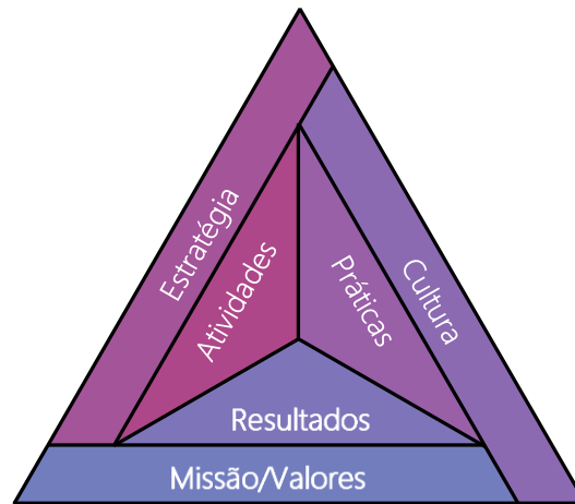
Figura 1 - Alinhamento organizacional.

No supracitado documento refere-se que a ESTBarreiro/IPS, valorizando os seus Recursos Humanos, deve ser um local de Inovação Científica, Pedagógica, Técnica, Processual, onde se ministra um ensino/aprendizagem de excelência, contribuindo efetivamente com valor para a Sociedade. A base da pirâmide mantém-se firme e inalterada, e consequentemente os resultados a alcançar permanecem os mesmos. Contudo, neste contexto da pandemia nem todas as atividades são permitidas, bem como as nossas práticas foram forçadas a sofrer alterações. Obedecendo à cultura institucional, as novas práticas e o leque mais condicionado de atividades conduzem necessariamente a uma redefinição da estratégia, o que se traduz no presente documento.